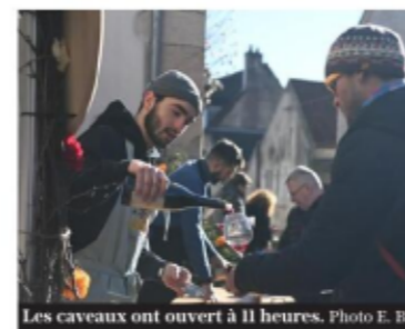
Les caveaux ont ouvert à 11 heures.