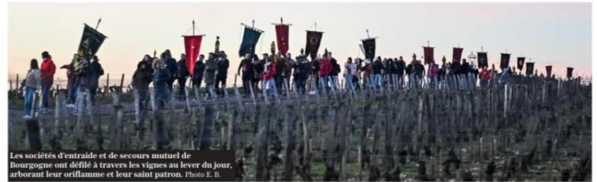
Les sociétés d'entraide et de secours mutuel de Bourgogne ont défilé à travers les vignes au lever du jour, arborant leur oriflamme et leur saint patron.