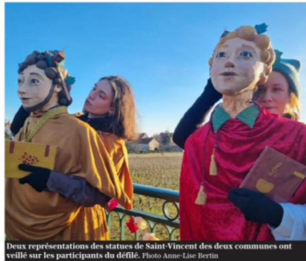
Deux représentations des statues de Saint-Vincent des deux communes ont veillé sur les participants du défilé.