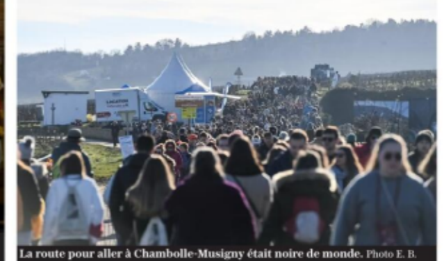
La route pour aller à Chambolle-Musigny était noire de monde.