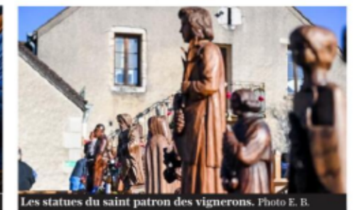
Les statues du saint patron des vignerons.