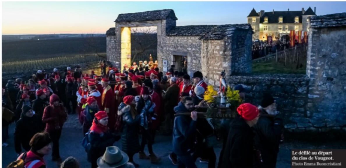
Le défilé au départ du clos de Vougeot.