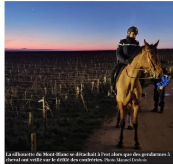
La silhouette du Mont-Blanc se détachait à l'est alors que des gendarmes à cheval ont veillé sur le défilé des confréries.