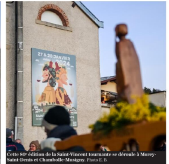
Cette 80 e édition de la Saint-Vincent tournante se déroule à Morey-Saint-Denis et Chambolle-Musigny.