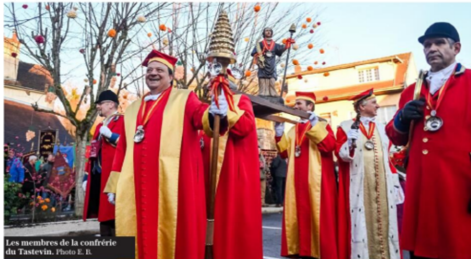
Les membres de la confrérie du Tastevin.

Morey-Saint-Denis et Chambolle-Musigny accueillent depuis samedi la 80 e édition de la Saint-Vincent tournante. La fête a débuté au clos de Vougeot, où les confréries se sont rassemblées dès 6 heures du matin avant le traditionnel défilé. La très belle lumière du lever du jour a fait de ce millésime 2024 un très grand cru. Après l'hommage aux vignerons disparus et les cérémonies religieuses dans les églises des deux communes et avant les intronisations des chevaliers du Tastevin, les caveaux ont ouvert leurs portes à 11 heures. Tout au long de la journée, sous un franc soleil, des milliers de visiteurs sont passés de caveau en caveau pour déguster les vins sélectionnés, mais aussi se restaurer et profiter d'animations festives. Ce dimanche, la fête continue.