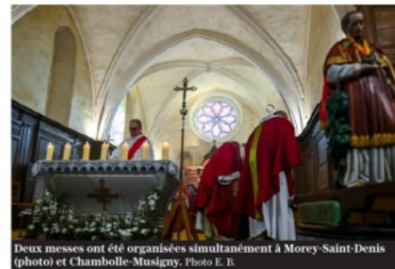
Deux messes ont été organisées simultanément à Morey-Saint-Denis (photo) et Chambolle-Musigny.