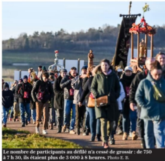
Le nombre de participants au défilé n'a cessé de grossir : de 750 à 7 h 30, ils étaient plus de 3 000 à 8 heures.